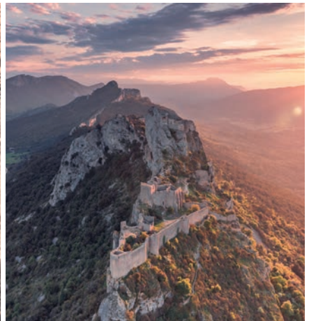
Château de Peyreperouse