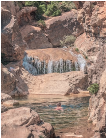
Gorges du Verdoble à Duilhac

Pour revenir au village, retourner au croisement, puis suivre le balisage jaune en direction de Duilhac. Suivre ce joli sentier en sous-bois puis prendre le chemin à droite (petite montée raide) qui ramène en 5 mn sur la départementale. Prendre à droite pour revenir au platane (200 m).